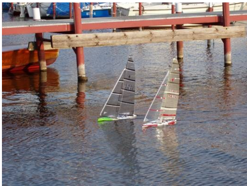
America's Cup im Kleinen – optisch machen die Fortunes ja was her. Wenn sie nur besser segeln würden ...